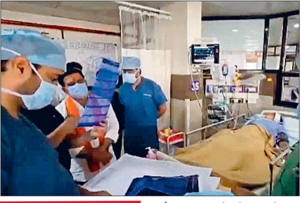
■ शनिवार को कवर्धा के सरोदा डैम पलानी पाट हुआ था हादसा