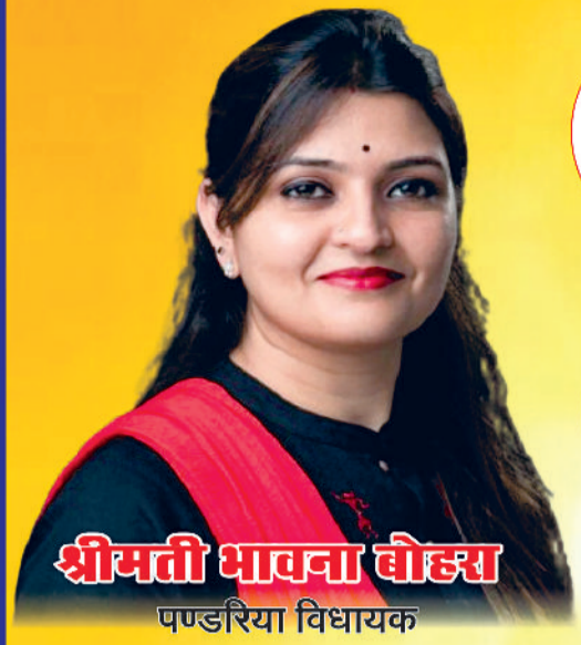
श्रीमती भावना बोहरा पण्डरिया विधायक