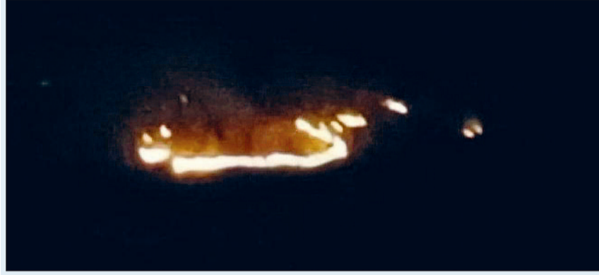
जंगलों का हर साल होता है भारी नुकसान

अभी ग्रीष्म ऋतु का ढंग से आगाज भी नहीं हो पाया है कि अंचल के जंगलों में अवैध कटाई के साथ-साथ आग का खतरा मंडराने लगा है। लेकिन दुर्भाग्य का विषय है कि वन विभाग इस खतरे से भी जंगलों को तबाह होने से नहीं बचा पा रहा है। ज्ञातव्य हो कि प्रायः पतझड़ के बाद गर्मी के दिनों में जंगल प्राकृतिक रूप से अथवा मानवीय चूक के चलते आगजनी का शिकार हो जाते हैं और पूरा जंगल आग की लपटों से घिर जाता है। इस बार भी ग्रीष्म ऋतु के शुरूआती दिनों में ही जिले के जंगलों में आग लगने की घटनाएं सामने आने लगी हैं। बताया जाता है कि बीते दिनों से विकासखण्ड बोड़ला क्षेत्र के तरेगांव तथा बोड़ला वन परिक्षेत्र के ग्राम मगरवाड़ा, खिरया, अचानकपुर सहित अन्य गांव के जंगलों में आग लगी हुई। जो रात के समय कई किलो मीटर दूर से भी साफ दिखाई दे रही है। लेकिन दुर्भाग्य का विषय है कि इन जंगलों में सुलग रही यह आग जिम्मेदार वन विभाग और उसके अमले को नहीं दिखाई दे रही है। नतीजतन आग बुझाने वन विभाग का कोई कर्मचारी मौके पर नजर नहीं आ रहा है। जिससे आग का दायरा बढ़ता जा रहा है। यहां बताया जाजिमी होगा कि ग्रीष्म ऋतु के दिनों में हर साल जिले के कवर्धा विकासखण्ड भोरमदेव,